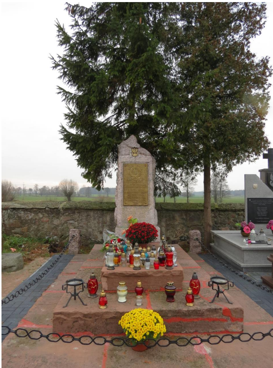
Śniadowo, cmentarz parafialny. Mogiła zbiorowa 26 nieznanych żołnierzy polskich poległych w walkach w sierpniu 1920 r.

We wsi Szczepankowo znajduje się ostatni zabytek gminy Śniadowo objęty ochroną prawną poprzez wpis do rejestru zabytków województwa podlaskiego. Dwór murowany stanowiący pozostałość założenia dworsko-folwarcznego, został wybudowany w latach 1825- 38 dla Józefy z Bykowskich i Ottona Henryka Milberga, jej męża. Wcześniej majątek należał do Antoniego Bykowskiego, ojca Józefy, który zakupił ją od Stanisława Skarżyńskiego, ten zaś dzierżawił go od rządu pruskiego. Od XII wieku do końca XVIII wieku ziemie należały do benedyktynów płockich. Po Milbergu - generale brygady Wojska Polskiego, dwór przeszedł na jego syna Władysława. W 1882 roku majątek jako