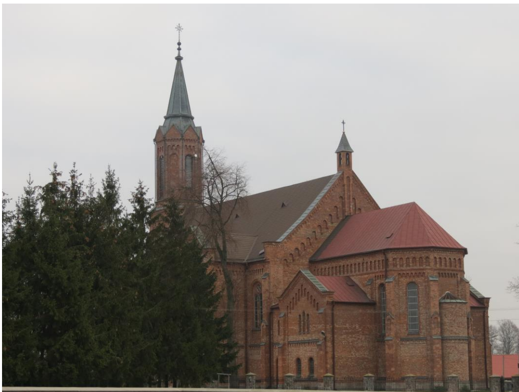
Kościół parafialny w Śniadowie

Romanowskiego przeprowadzono remont pokrycia dachowego, a wewnątrz dokonano malowania i wystroju kościoła według projektu Zbigniewa Łoskota. Staraniem ks. prob. Zbigniewa Gołubowskiego w latach 1980-2000 zostały przeprowadzone gruntowne prace remontowe wewnątrz i zewnątrz kościoła łącznie z wymianą dachu i nowym wystrojem prezbiterium.